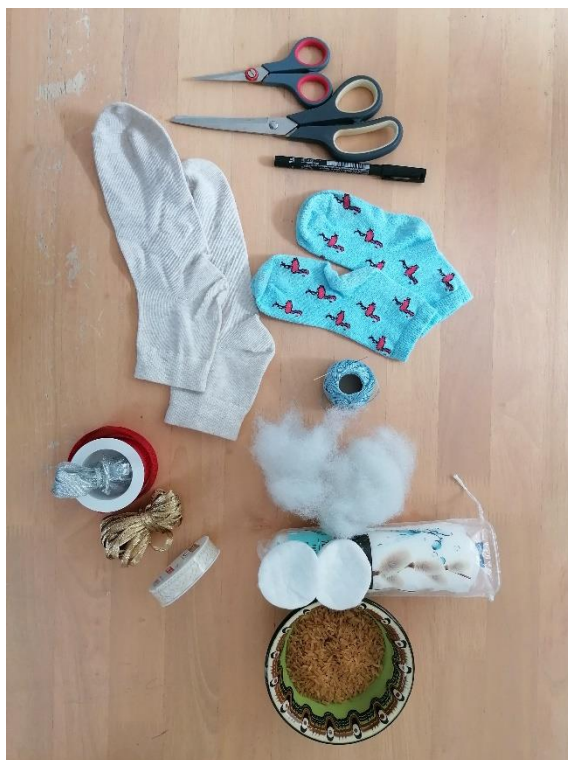
Fotografija 1. Potrebni material za izdelavo

Ko imamo vse pripravljeno, se lahko lotimo dela.