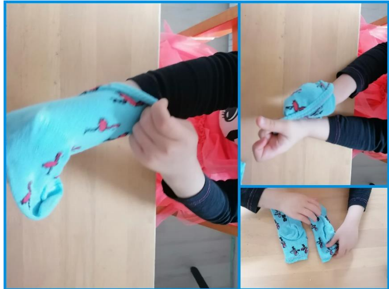
Fotografija 2. Obracanje nogavice

Nogavico najprej obrni okoli, na narobno stran, in jo poravnaj.