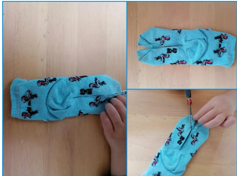
Fotografija 3. Rezanje ušes

Po sredini (od prstov do pete) s flomastrom nariši črto. S škarjami zareži po črti. Zgornja dela na notranji strani zareži tako, da nastane trikotnik. Pripravi si iglo in sukanec ter vse izrezano dobro zašij.