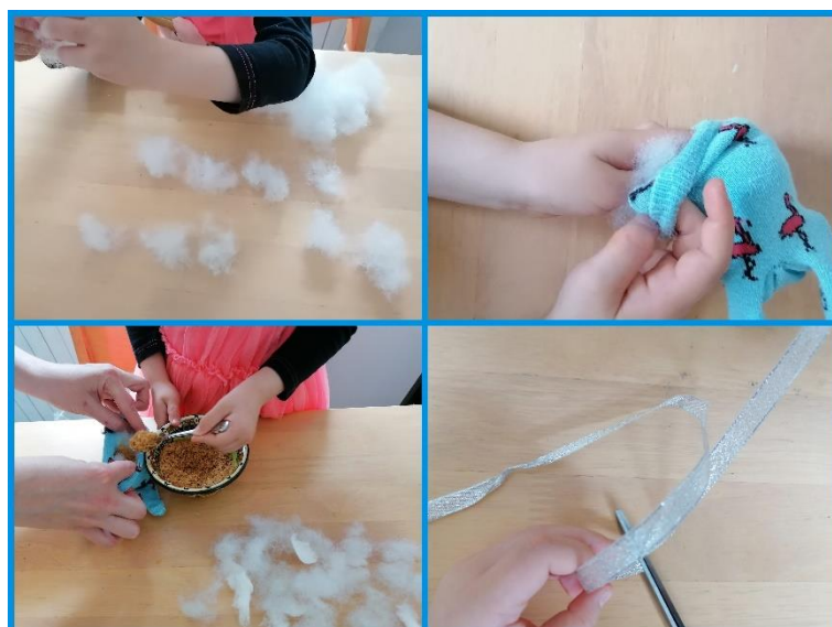
Fotografija 6. Polnjenje

Dobljeno nogavico napolni s polnilom. Polnilo je lahko vata, riž, ajdova kaša, lahko pa kombinacija vsega. Na koncu dobro zašij ali zaveži s trakom, da polnilo ne bo padalo iz zajčka.