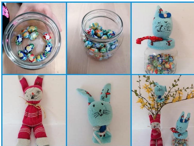
Fotografija 8. Zajčki iz nogavic

Zajčki so lahko tudi prav imeniten pokrov manjšega steklenega kozarca, v katerem se skrivajo slastna čokoladna jajčka.